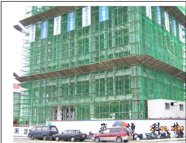
(A) RC 結構體設置防塵網