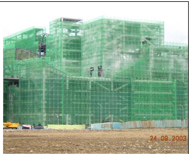
(B) SRC 結構體設置防塵網