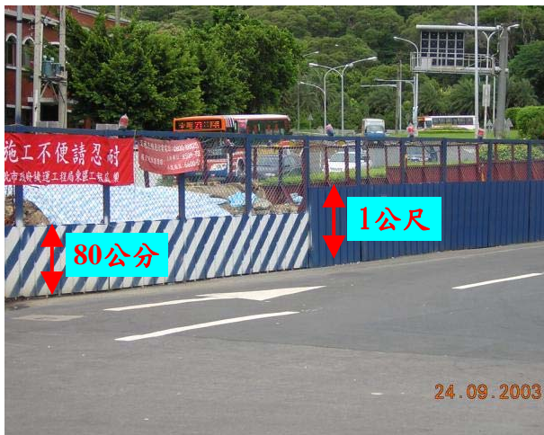
(C) 半阻隔式圍籬(捷運工程)