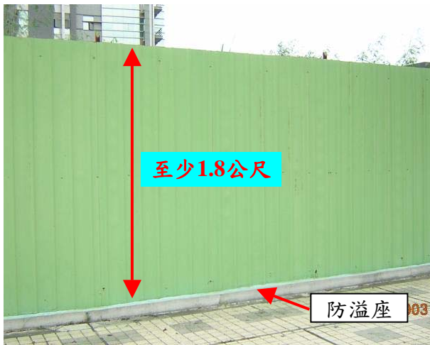
(A) 全阻隔式圍籬及防溢座