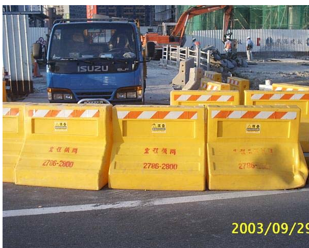
(E) 簡易圍籬—塑膠製紐澤西護欄