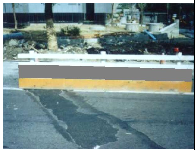
(F) 簡易圍籬—下半部密閉式拒馬