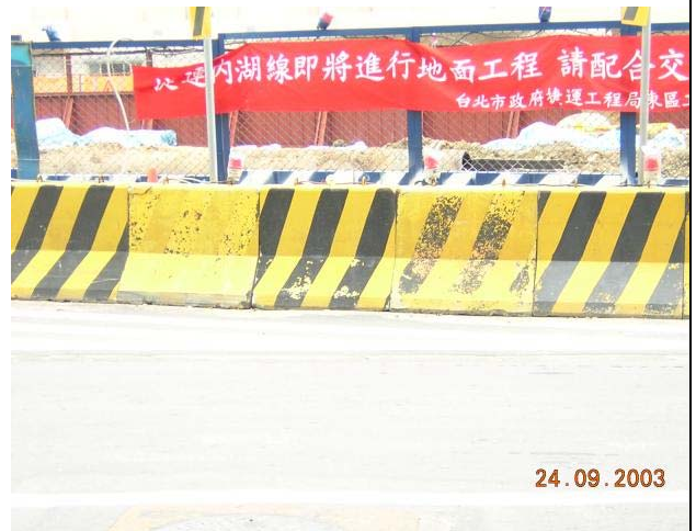
(D) 簡易圍籬—水泥製紐澤西護欄